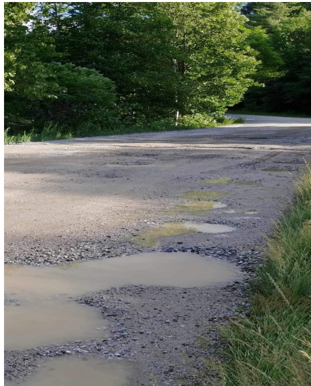
Chemin Lac Desormeaux en détresse.