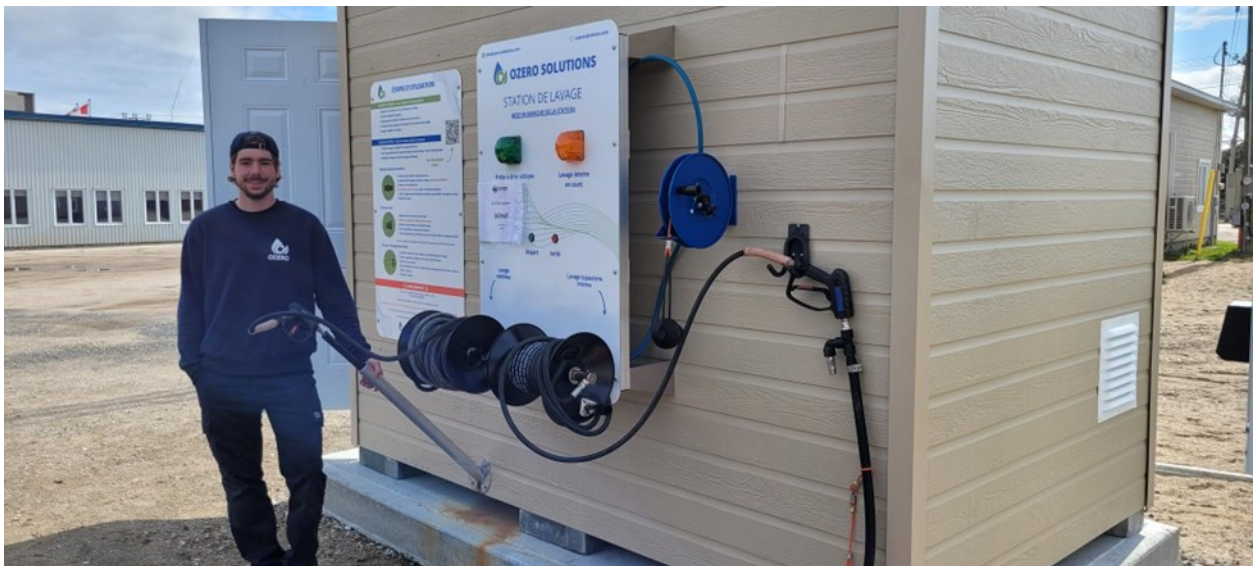
Maxime Guay, l'un des propriétaires d'OZERO Solution, effectue les réglages de la nouvelle station de lavage de bateaux à Gracefield.

https://www.environnement.gouv.qc.ca/biodiversite/especes-exotiques-envahissantes/myriophylle-epi/index.htm